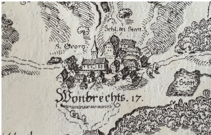
Karte in der Version Kupferstich 1647

Neben den Darstellungen des Ortsbildes ist auch die Veränderung der Sprache augenscheinlich. Die große Rechtschreibreform aus dem Jahr 1996 hat unsere aktuell geschriebene Sprache deutlich verändert. Offenbar erfuhr aber die deutsche Sprache in der Zeit zwischen 1617 und 1647 einen nicht weniger weitreichenden Eingriff. Möglicherweise hatte der 30-jährige Krieg (1618 bis 1648) einen wesentlichen Einfluss. Im Folgenden eine vergleichende Sprachdarstellung der Jahre 1617, 1647 und 2023.