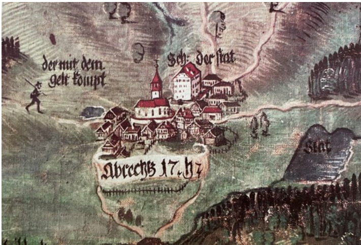
Karte gemalte Version 1617

Den damaligen Ort Wohmbrechts mit der heutigen Struktur zu vergleichen ist äußerst schwierig. Zum einen können Perspektiven täuschen, trotz der detaillierten Darstellung. Zum anderen hat bis auf Teile der Kirche und des Schlosses kaum ein Gebäude seinen Bestand bis heute bewahren können. Selbst das sog. Bodenmüllerhaus auf dem Dorfplatz (Baujahr ca. 1665) ist erst ein halbes Jahrhundert nach Erstellung dieser Karte entstanden.