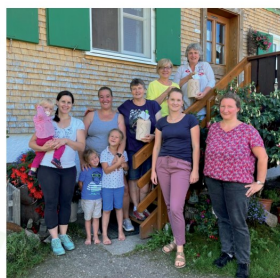
Nochmals ein herzliches Dankeschön an unsere ehemalige Vorstandschaft für ihr jahrelanges Engagement.

Die Vorstandschaft der Hergatzter Bäuerinnen